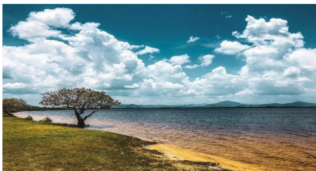
Figura 7: Lago do Caracaranã