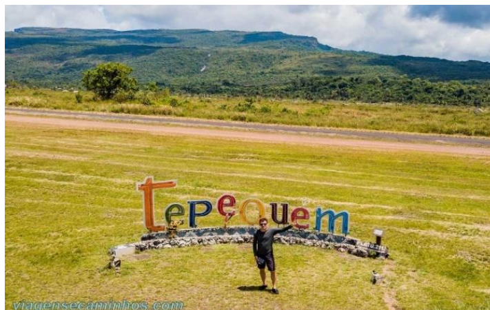
Figura 3: Serra do Tepequém (Letreiro)