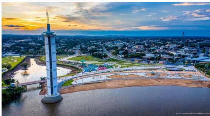
Figura 1: Mirante Edileuza Loz e a Maior Selvinha Amazônica de Boa Vista