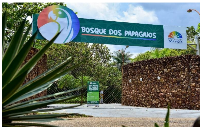
Figura 2: Parque Ecológico Bosque dos Papagaios