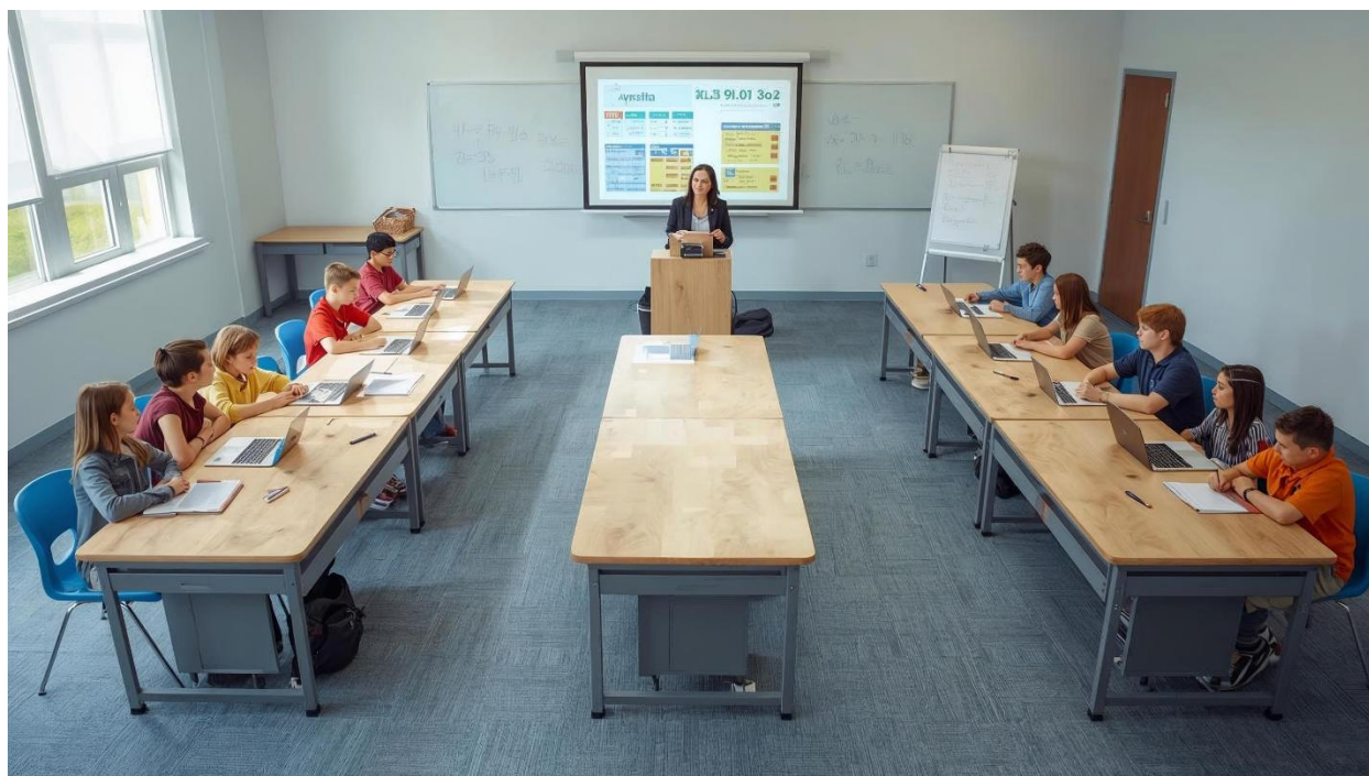
Figura 1 – Layout Similar ao da Sala de Aula da Aprendizagem Baseada em Equipes.