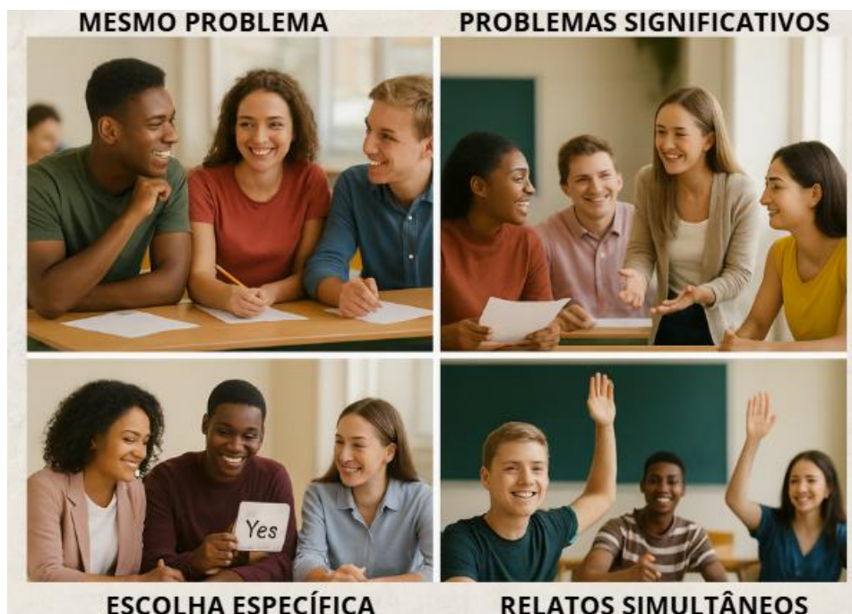
Figura 3 – Chaves para a construção de tarefas em equipe eficazes