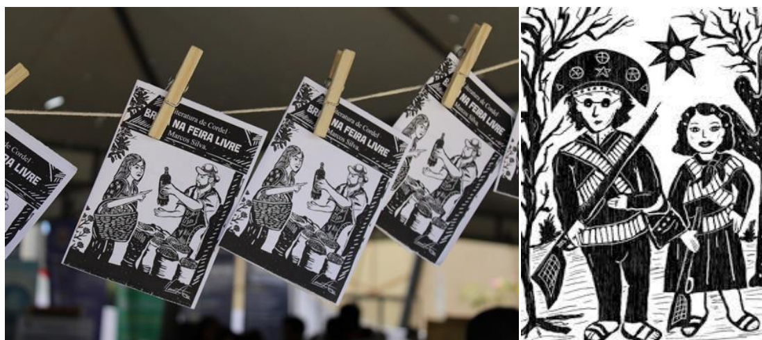
Figura 3: literaturas em cordéis (à esquerda) e a arte da xilogravura (à direita).