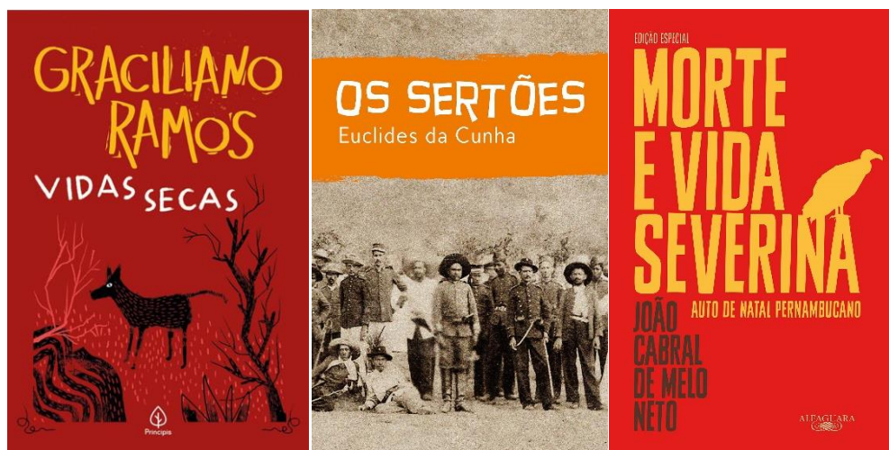
Figura 2: principais obras da literatura que retratam a realidade sertaneja.